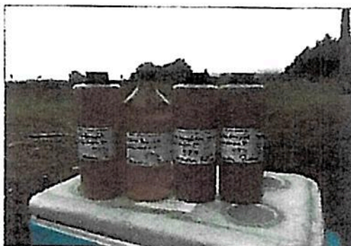
Fotografía 1: Set de Batería